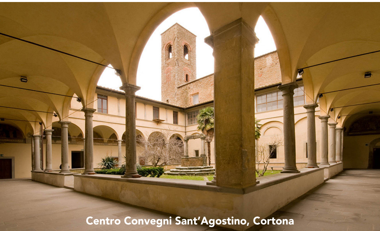
Centro Convegni Sant'Agostino, Cortona

L'assegnazione dei crediti formativi E.C.M. è subordinata alla presenza effettiva al 90% delle ore formative, alla corretta compilazione della modulistica e alla verifica di apprendimento mediante questionario online con almeno il 75% delle risposte corrette. L'attestato riportante il numero dei crediti sarà rilasciato solo dopo aver effettuato tali verifiche.